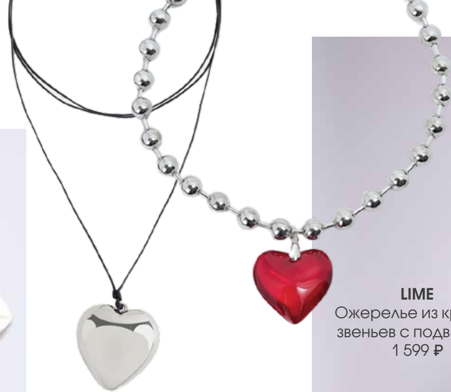
LIME Ожерелье из круглых звеньев с подвеской 1 599 ₺