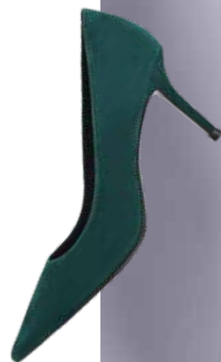
EKONIKA Женские туфли 17 990 ₺