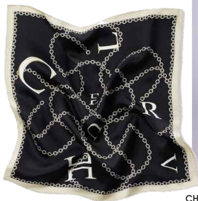
CHARUEL Платок из 100% шелка 4 590 ₺