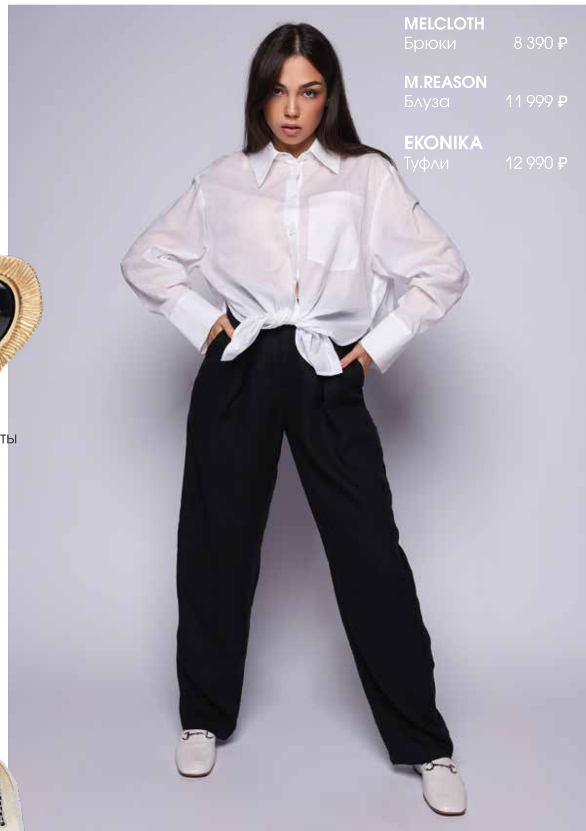
MELCLOTH Брюки 8 390 ₺