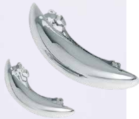
LOVE REPUBLIC Набор заколок для волос 1 999 ₺