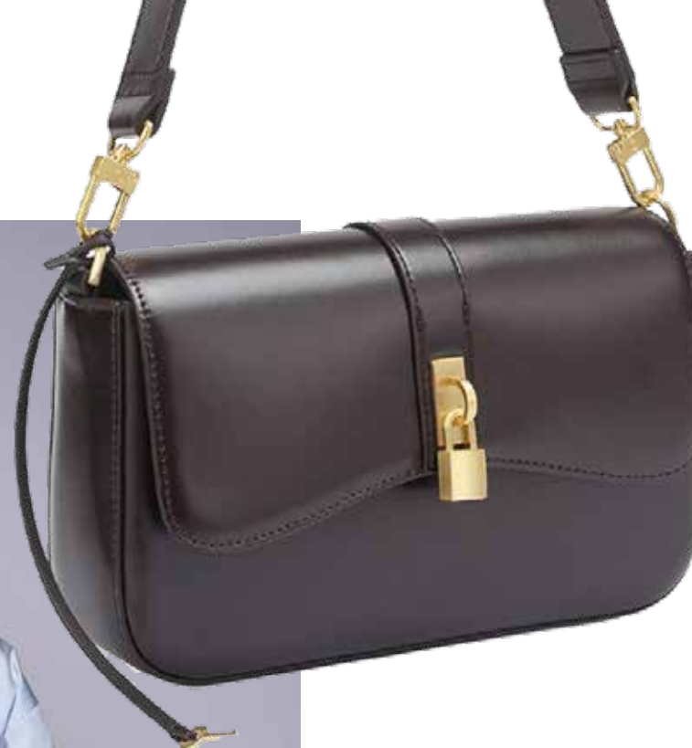
EKONIKA Женская сумка кросс-боди 16 990 ₺