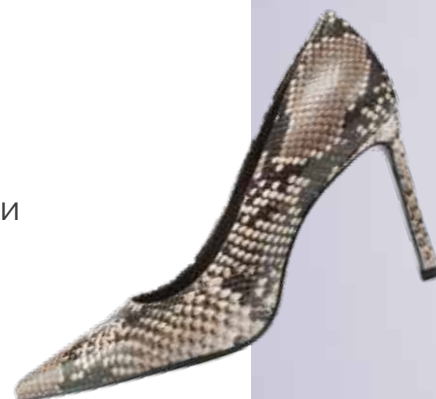
EKONIKA Женские туфли 22 990 ₺