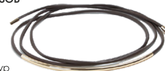
LIME Тонкий ремень-шнур 1 999 ₺

Сочетание голубого и бежевого подойдет тем, кто любит создавать одновременно минималистичные и выразительные образы, сохраняя свою индивидуальность.