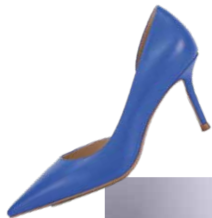
EKONIKA Женские туфли 9 990 ₺.