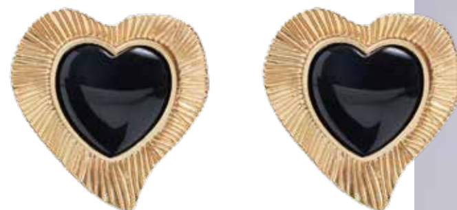
LIME Комбинированные серьги-пусеты 1 599 ₺

Свободные брюки + рубашка, завязанная на талии нестандартным способом - must have этого сезона.