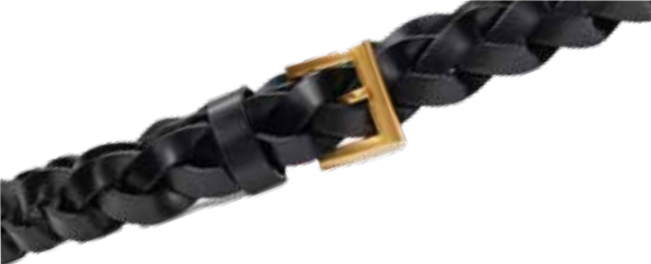
EMKA Ремень из натуральной кожи 4 190 ₺