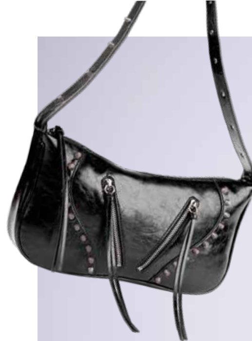
Женская сумка-багет EKONIKA 10 990 ₺