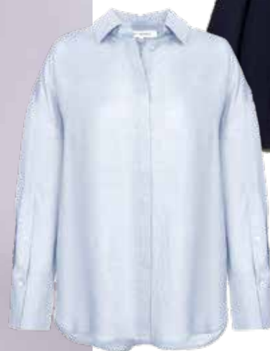
LOVE REPUBLIC Рубашка из 100% льна 5 599 ₺