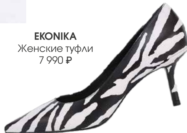
EKONIKA Женские туфли 7 990 ₺