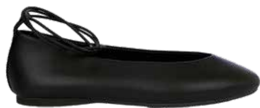
LOVE REPUBLIC Балетки из натуральной кожи 8 999 ₺