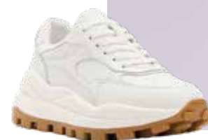
RENDEZ-VOUS Женские кроссовки TENDANCE 12 590 ₺