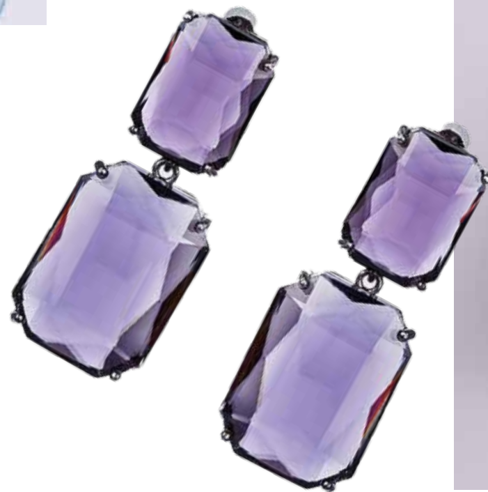
LOVE REPUBLIC Серьги-пусеты с крупными камнями 1 399 ₺