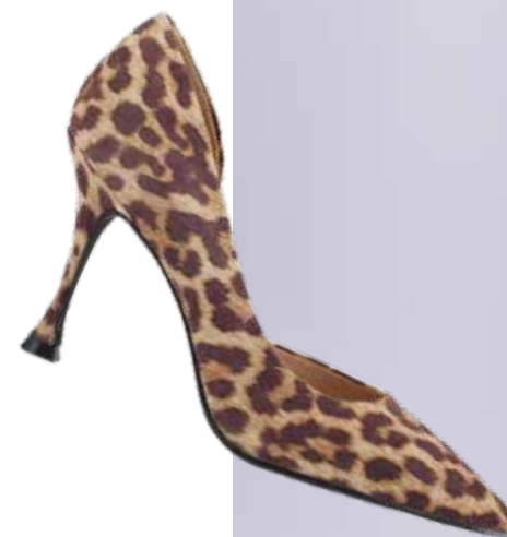
EKONIKA Женские туфли 15 990 ₺