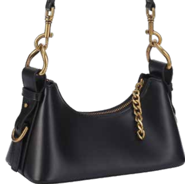
EKONIKA Женская сумка-хобо EKONIKA PREMIUM 26 990 ₺