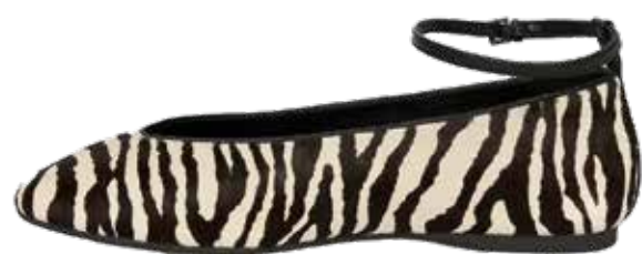
LOVE REPUBLIC Балетки из натуральной кожи 11 999 ₺