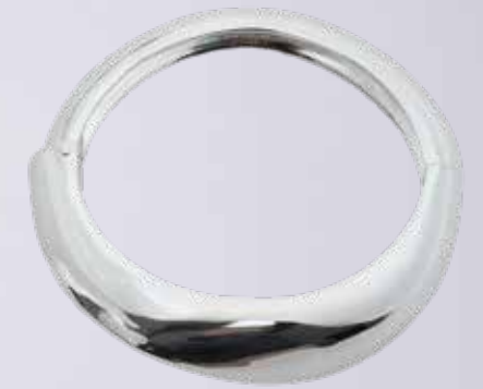
LIME Металлический браслет 1 599 ₺